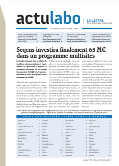
La lettre d'information