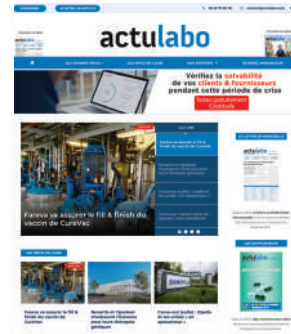
Le site web www.actulabo.com