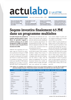
La lettre d'information