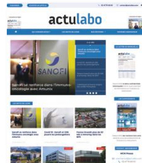
Le site web www.actulabo.com